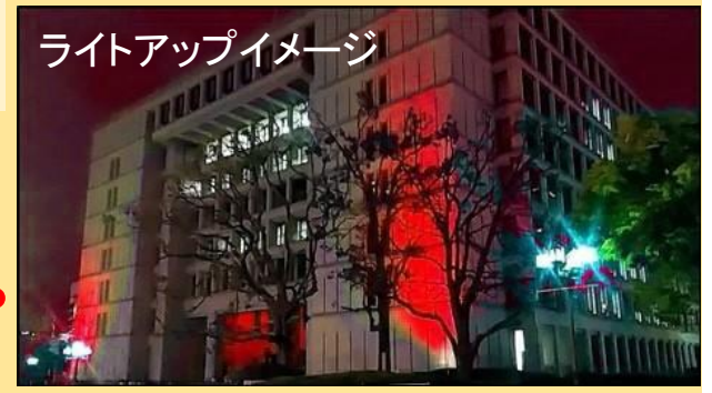
ライトアップイメージ

令和3年9月21日(火曜日)「世界アルツハイマーデー」には、 市本庁舎を認知症支援の色である「オレンジ」にライトアップ