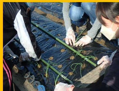
ボランティアさんによる 玉葱の苗植え講習会