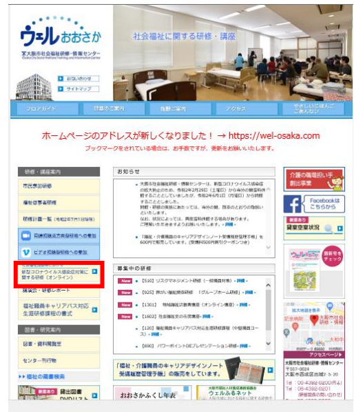
大阪市社会福祉研修・情報センターの ホームページ (PC版)

いただいた質問に対するQ&Aにつきましては、現在、準備中です。 準備が整いましたら上記のページで公開します。