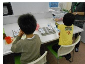
コミュニケーション (おやつ場面)