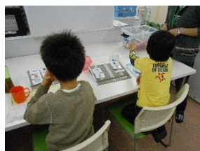
コミュニケーション (おやつ場面)