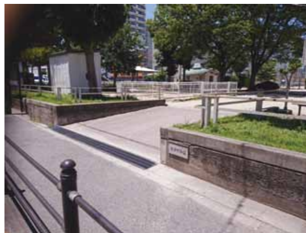
(例) 吉野町公園（藤棚） （町会集合場所）