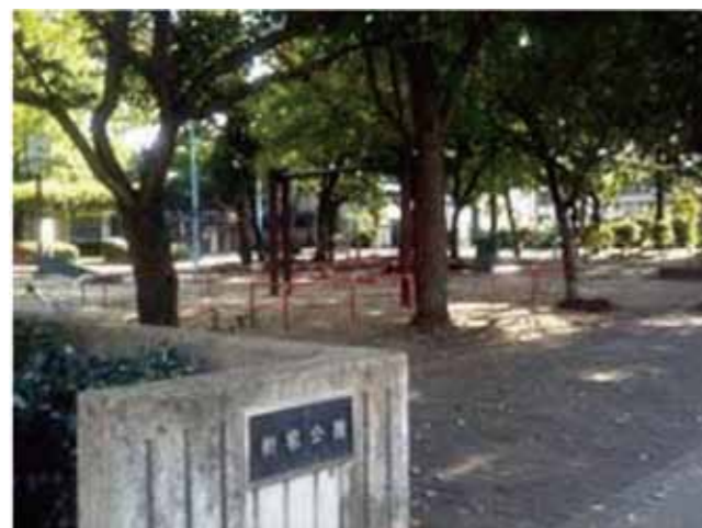
(例) 新家公園（町会集合場所）

自助（自ら災害等に備えたり避難したり自分の身を守る）⇒共助（地域住民同士による助け合い）⇒公助（公的機関によって提供される援助）の順で行動します。