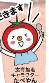
食育推進 キャラクター たべやん