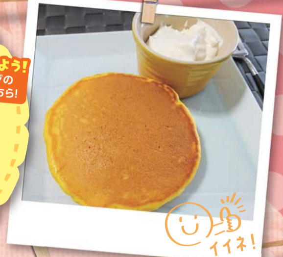
イネ! いただきます