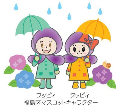
フッピー クッピー 福島区マスコットキャラクター

発行編集 | 福島区役所 企画総務課 〒553-8501 大阪市福島区大開1丁目8番1号 TEL 6464-9683 FAX 6462-0792