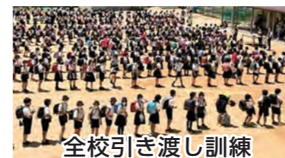
全校引き渡し訓練