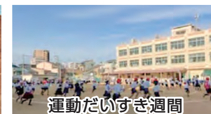
運動だいすき週間