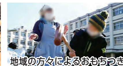
地域の方々によるおもちつき