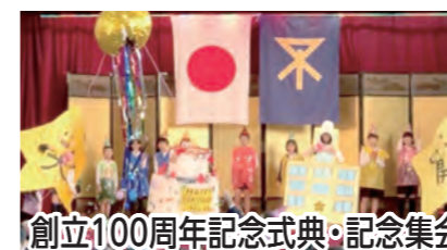
創立100周年記念式典・記念集会