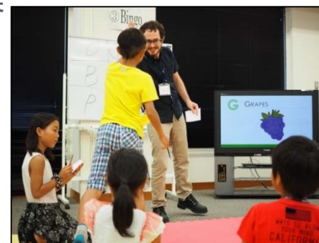
英語交流イベントのようす