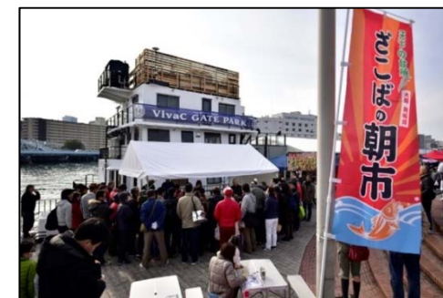
ざこばの朝市の様子