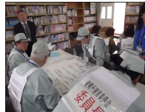
避難所開設運営訓練のようす