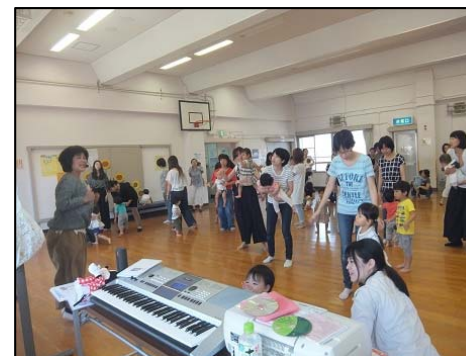
子ども子育てプラザで講座を受講する親子