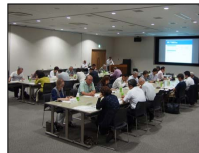
福島区区政会議のようす