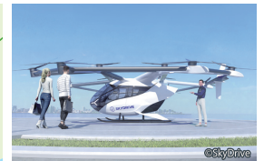
空飛ぶクルマの機体イメージ