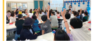
クイズ大会の様子

小学生を対象に、水に関するワークショップや体験型のイベント、謎解きなどを開催。定員各回70人。