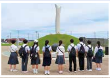
千年希望の丘 相野釜公園慰霊碑(宮城県)

今年も、7月に区内3中学校の生徒代表9名が岩手県などを訪問します。東日本大震災の被害や復興への道のり、防災について学ぶとともに、現地でのSDGsの取組についても体験し、理解を深めます。また、参加した中学生が、訪問を通じて経験したことを持ち帰り、学校や地域で報告することにより、他の中学生の防災意識等の向上や、中学生と地域との連携強化につながります。