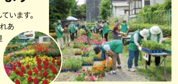
花づくり広場(下福島公園)

福島区の緑化活動を一緒に盛り上げてくださる、緑化リーダーを募集しています。緑化リーダーの皆さんが育てた花苗を、区役所前の花壇や江成公園ふれあい花壇に植え付けるほか、小学校や保育所などの公共施設等に花苗を提供しています。