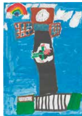
令和5年度障がい者週間のポスター 小学生部門 最優秀賞作品

はHPをご覧ください。 9/3 福祉局障がい福祉課 06-6208-7992 06-6202-6962