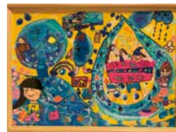
令和5年度 特選(2年生)

水道や水に関する絵を募集。対象は市内在住または在学の小学生。 9/4 申 応募用紙(HPで入手可)に住所・氏名・電話番号・学校名・学年・タイトル・絵の説明を書いて作品(画用紙)の裏面に貼り、持参または送付で、〒559-8558住之江区南港北2-1-10 ATC ITM棟9階、水道局総務課ほかへ。 06-6616-5404 06-6616-5409