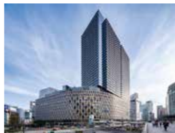
第42回大阪市長賞:大阪梅田ツインタワース・サウス

周辺環境の向上に資し、かつ景観上優れた建物やまちなみを推薦していただき、特に優秀なものを表彰します。 7/31(消印有効) 申 HPまたは市役所、区役所、大阪市サービスカウンター(梅田・難波・天王寺)などで配布する推薦ハガキ付きリーフレットに必要事項を書いて、大阪都市景観建築賞運営委員会へ。 計画調整局都市計画課 06-6208-7887 06-6231-3751