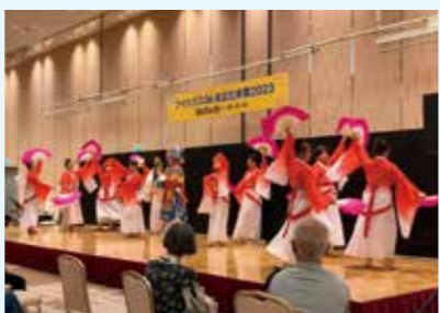
昨年の様子(中国の京劇)

日本在住の外国人による言葉、文化、料理の紹介や、伝統楽器の演奏、踊り、劇などを楽しめるイベントを開催。さまざまな文化への理解を深めましょう。 日 8/3(土)11:00～16:30 場 大阪国際交流センター(天王寺区) 問 (公財)大阪国際交流センター ☎06-6773-8989 ☎06-6773-8421