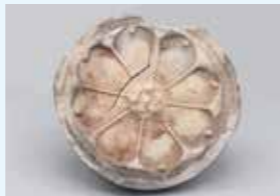
難波宮造営以前の素弁八葉蓮華文軒丸瓦 難波宮跡出土 7世紀前葉 大阪市教育委員会蔵

なにわのみや 難波宮跡の第1次発掘調査開始から70年の節目を記念した特別展を開催。発掘調査成果を中心に、周辺資料や伝承をまじえながら、難波宮の画期性と「大化改新」のかかわりを分かりやすく紹介します。 日 7/5(金)～8/26(月)9:30～17:00 (入館は16:30まで)、火曜休館(8/13は開館) 大人1,100円ほか 場 大阪歴史博物館 ☎06-6946-5728 ☎06-6946-2662