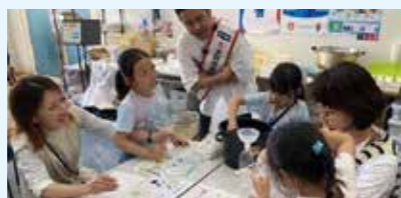
水に関する実験の様子

水に関するワークショップや体験型のイベント、謎解きなどを開催。対象は未就学児～小学生。定員各回70人。 日 ①7/20(土)・21(日)②7/27(土)・28(日)各日10:00～11:15、12:20～13:35、14:30～15:45 申 ①7/7 ②7/14 各17:00までにHPで。 場 水道記念館 ☎06-6320-2874 ☎06-6324-3114