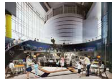
リニューアル後のイメージ 地下1階「アトリウム」

プラネタリウムや体験展示で、科学をわかりやすく伝える電気科学館開館からの歴史をはじめ、新たな展示場や活動を紹介します。