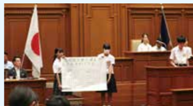
昨年の様子(中学生市会)

市長に質問や提案をするために、議員になってみませんか。対象は市内在住または在学の小学5・6年生。定員81人。 日 8/19(月)14:00～17:00 場 市役所8階 市会本会議場 締 7/8 申 学校で配布される応募用紙(HP)にも掲載)に必要な事項を書き、学校を通して応募。 問 教育委員会初等・中学校教育担当 ☎06-6208-9186 ☎06-6202-7055