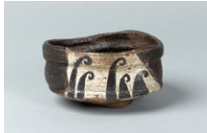
黒織部波文茶碗 松恵コレクション 桃山時代(17世紀) 美濃窯

初公開の茶道具を中心とした「松恵コレ クション」や、中国陶磁の酒器を中心と した「入江正信コレクション」などを、オ ムニバス方式で紹介します。