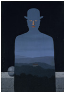
ルネ・マグリット 《王様の美術館》1966年 横浜美術館

国内に所蔵されている多様なジャンルの 優品を一堂に会し、シュルレアリスム の本質に迫る展覧会。圧倒的な存在感 で、視覚芸術から社会全体へと拡大した シュルレアリスムを、表現の媒体をキー ワードとして解体、再構築します。