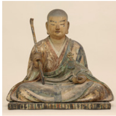
重要文化財 木造僧形八幡神像 正平8年～9年(1353～1354) 壺井八幡宮蔵

源義家や源頼朝、足利尊氏らを輩出し、 武士の世の礎を築いた河内源氏一族 と、彼らの守護神として長らく武家の 崇敬を受けた壺井八幡宮の歴史を紹介 します。