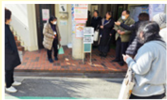
見守り活動へ出発!