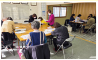
訪問に向けた打ち合わせ