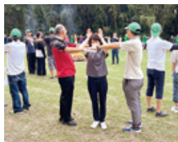
全体研修会での交流の様子