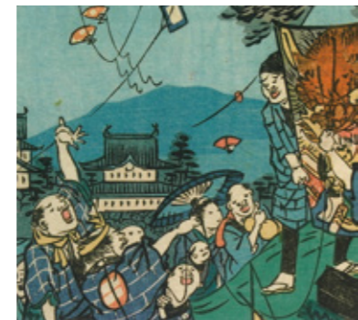
錦絵『花暦浪花自慢』より