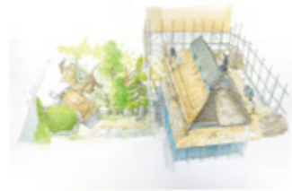
茅屋根葺き替え作業風景

イラストレーター・綱本武雄が相続した築およそ140年の空家を修復・再生し、自宅として暮らしはじめる過程を描いたイラスト作品や記録ノート、修復の各工程の写真などを展示。「直す」「つなぐ」「暮らす」をキーワードに、古民家を直す楽しさ、暮らす豊かさを伝えます。