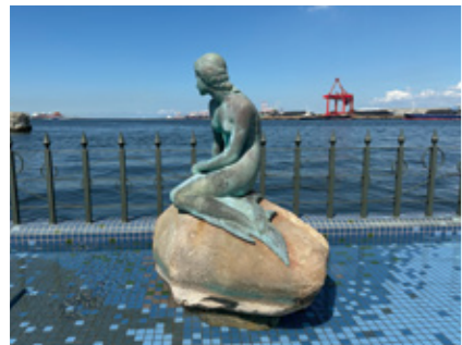
大阪ベイエリア（マーメイド像）

八幡屋公園を出発し、大阪港が一望できるベイエリアを街歩き。ロングコースでは渡船を利用して港区・大正区をめぐる。小学生以下は保護者同伴。第三者のサポートが必要な方は介助者同伴。