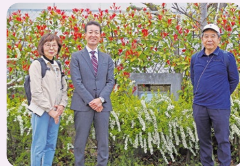
新家西公園の旧町名継承碑(旧町名 下島町)の前で