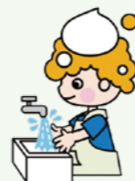
大阪市食中毒予防啓発キャラクター「やっぷちゃん」