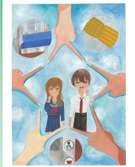
令和6年度 障がい者週間のポスター 中学生部門 最優秀賞作品

障がいのある人とない人との心のふれあいをテーマにした①作文②ポスターを募集。対象は市内在住または在学の①小学生以上②小・中学生。申込方法など詳しくは HP をご覧ください。 📅 9/2 🗨️ 福祉局障がい福祉課 ☎️ 06-6208-8075 📠 06-6202-6962