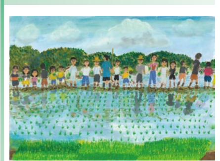
令和7年度 特選(3年生)

水道や水に関する絵を募集。対象は市内在住または在学の小学生。 📅 9/4 📄 申 HP 応募用紙( HP で入手可)に住所・氏名・電話番号・学校名・学年・タイトル・絵の説明を書いて作品(画用紙)の裏面に貼り、持参または送付で、〒559-8558住之江区南港北2-1-10 ATC ITM棟9階、水道局総務課ほかへ。 ☎️ 06-6616-5404 📠 06-6616-5409