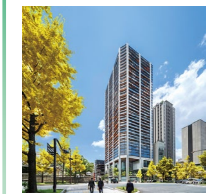
第44回 大阪市長賞：御堂筋ダイビル

周辺環境の向上に資し、かつ景観上優れた建物やまちなみを推薦してください。特に優れたものを表彰します。 📅 7/31(消印有効) 📄 申 HP または市役所・区役所・大阪市サービスカウンター(梅田・難波・天王寺)などで配布する推薦募集リーフレットに必要事項を書いて、大阪都市景観建築賞運営委員会へ。 🗨️ 計画調整局都市計画課 ☎️ 06-6208-7885 📠 06-6231-3751