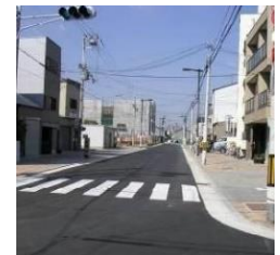
都市計画道路の整備