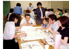
地域の方々とのワークショップ