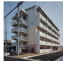
従前居住者向け市営住宅の建設