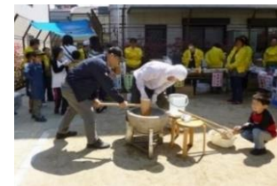
広場を活用した地域イベント