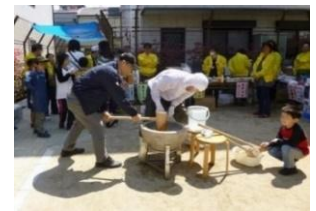
広場を活用した地域イベント