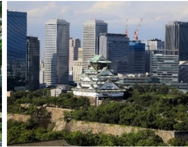
大阪城 (大阪市歴史博物館からの眺め)