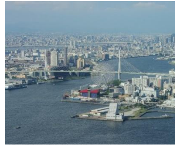
ベイエリア (大阪府茨州庁舎からの眺め)