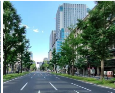
御堂筋 (御堂筋沿道の眺め)