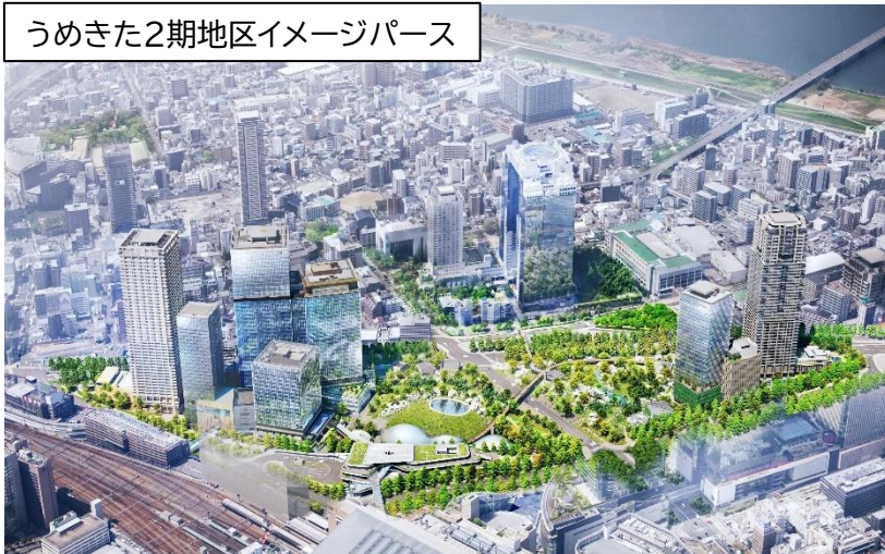
うめきた2期地区イメージパース