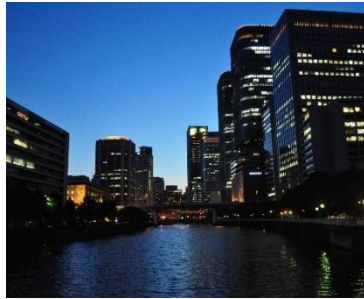
中之島 (淀屋橋からの眺め)