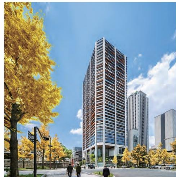
令和6年度「市長賞」受賞 御堂筋ダイビル