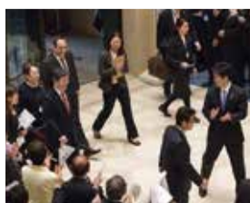
大阪府庁での歓迎の様子