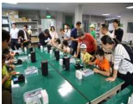
わが町工場見てみ隊