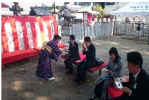
深江歴史文化まつり