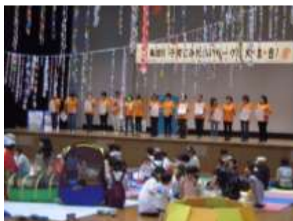
子育てふれあいサークル大・集・合！