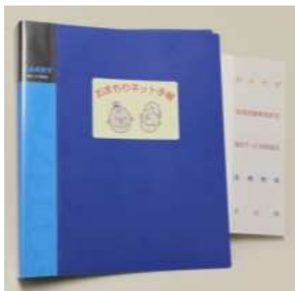
おまもりネット手帳

「おまもりネット事業」をはじめとした地域福祉活動を推進するとともに、要支援者の個別支援のためのコーディネートを行う。