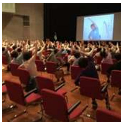
「いきいき百歳体操」講演会

健康寿命を延伸するため、食育の推進をはじめ、介護予防活動として「いきいき百歳体操」の普及啓発など、区民が主体的、継続的に健康づくりに取り組める環境づくりを推進する。