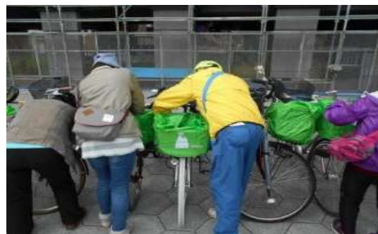
ひったくり防止カバー取付キャンペーン