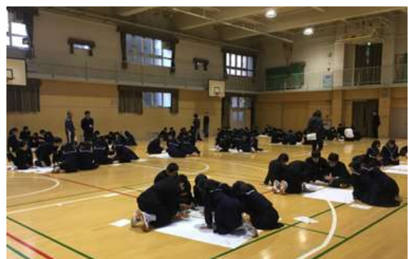
玉津中学校避難所運営ゲームの様子 平成 29 年 12 月 14 日