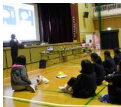
中学校での「食育講座」