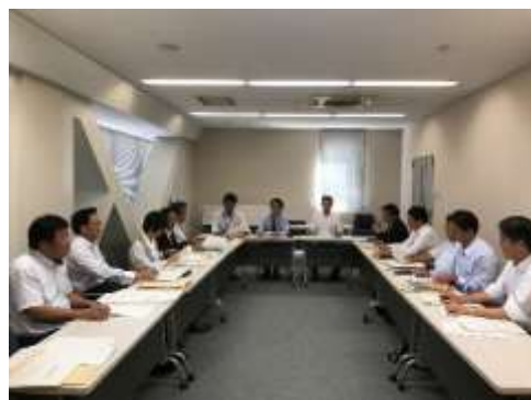
学校長との意見交換会