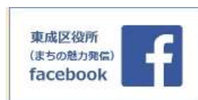
フェイスブック (まちの魅力発信)