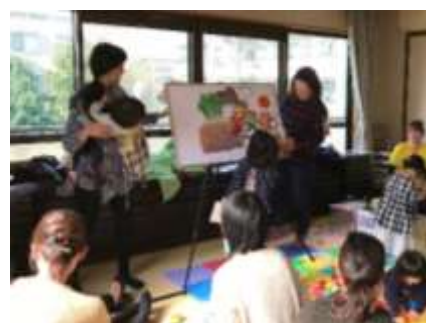
子育て応援隊 ♪さんぽっぽ♪