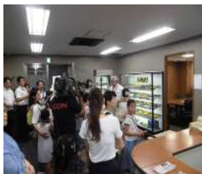
わが町工場見てみ隊

区の特徴である「モノづくり」を通じて、次世代を担う人材育成に取り組むとともに、モノづくり以外についても地域資源を再発見・再認識し、効果的な情報発信を行うため他団体と連携し検討していく。