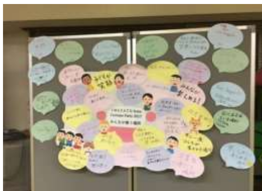
企画会議で提案されたテーマ