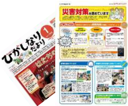
ひがしなりだよりでの防災特集 平成 30 年 1 月号