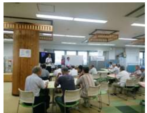
まちづくり交流会