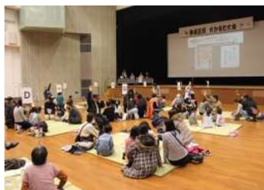
東成区民かるた大会