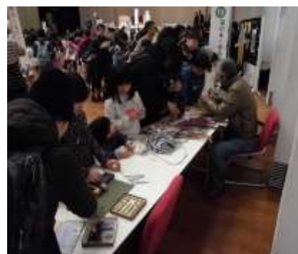
東成こどもモノづくり体験フェスタ