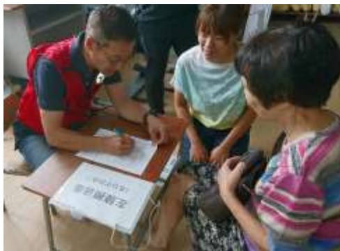
今里連合震災訓練（医師会と連携した救護所開設の様子）

自主防災組織が主体的に、実践的な避難所運営訓練などを企画立案できるように支援するとともに、協力企業等登録制度による協力企業の拡充を図る。