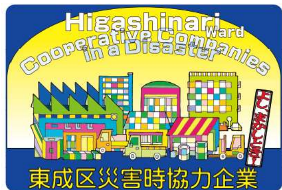
登録企業等に配布し、掲示いただいているステッカー