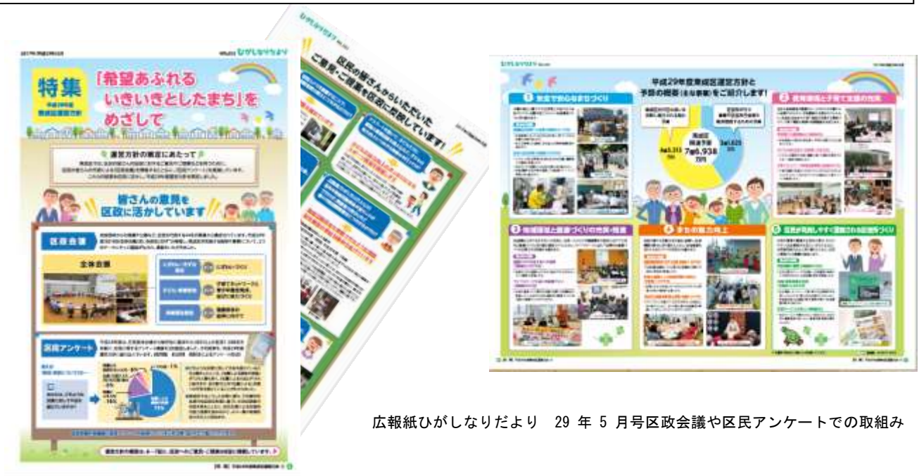
広報紙ひがしなりだより 29 年 5 月号区政会議や区民アンケートでの取組み

活発な意見交換に向け、区政会議運営上の課題把握のためのアンケートを実施し、会議運営の改善を図る。また、いただいた意見についての対応状況を区政会議において示す。