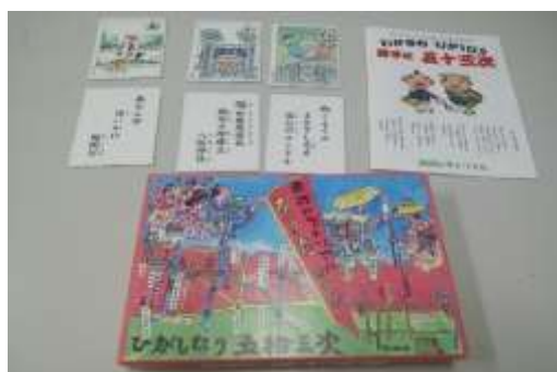
完成した「わがまち東成 勝手に五十三次かるた」