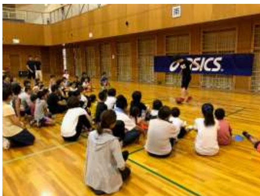
フリースタイルフットボール教室