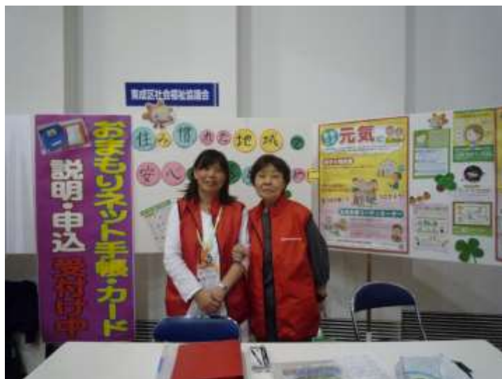
おまもりネット事業相談・説明会