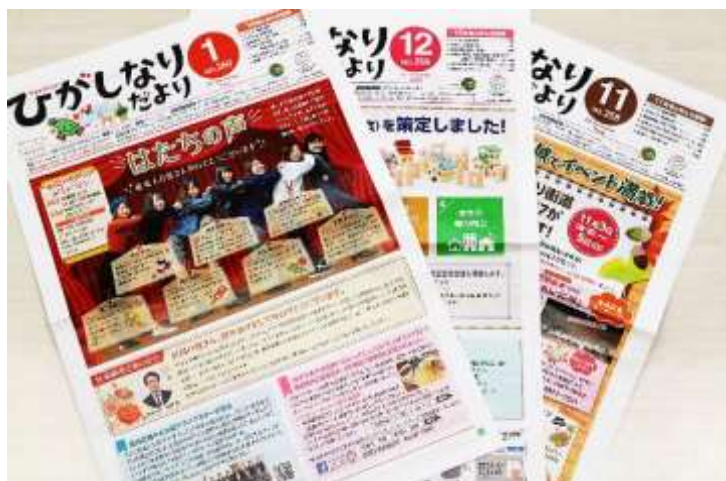
広報紙「ひがしなりだより」

広報紙やホームページなど様々な広報媒体を活用し、わかりやすく魅力的な広報を行う。