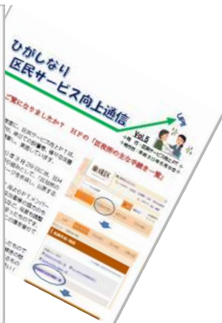
職員プロジェクトチーム作成庁内情報紙