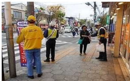
自転車利用マナーアップキャンペーン