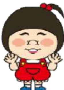
大阪市と吉本興業が作成した DVD を使用します