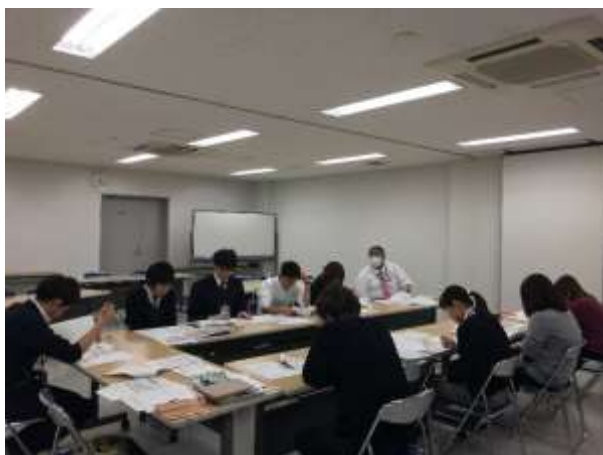
区民サービス向上 PT 会議風景

個人情報を取り扱う事務について、ルール遵守の意識を徹底するとともに、規模の大きい事業などの業務スケジュールを見える化し、組織での共有を通して、自律的な PDCA サイクルの徹底を促進する。