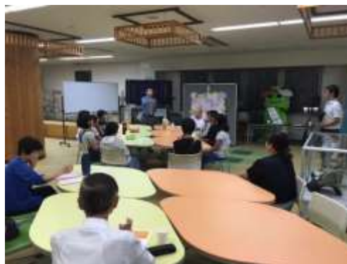
ふれ愛パンジーでの企画会議