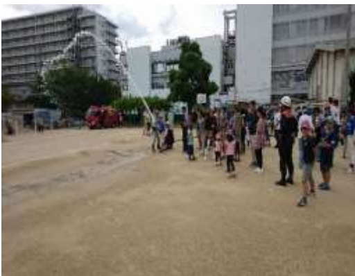
各地域の震災訓練

地域活動協議会に対し、地域ごとの特性や地域課題を把握したうえで、地域実情に応じたきめ細やかな支援を実施する。（地域活動協議会の事業企画・運営能力等の強化や、認知度向上に向けた情報発信力の強化など）