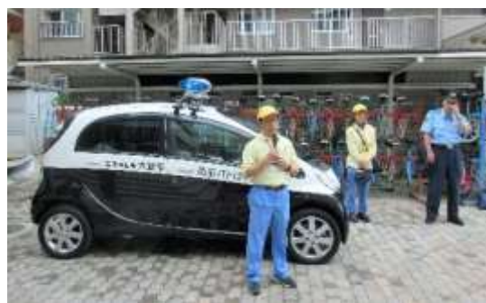
あんパトによる地域巡回