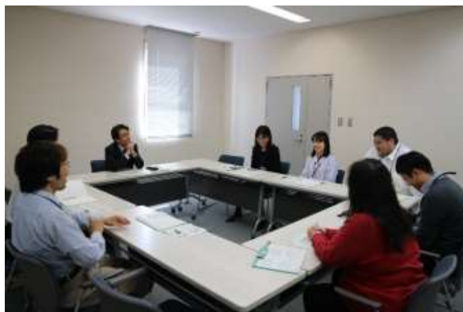
区長と職員との意見交換