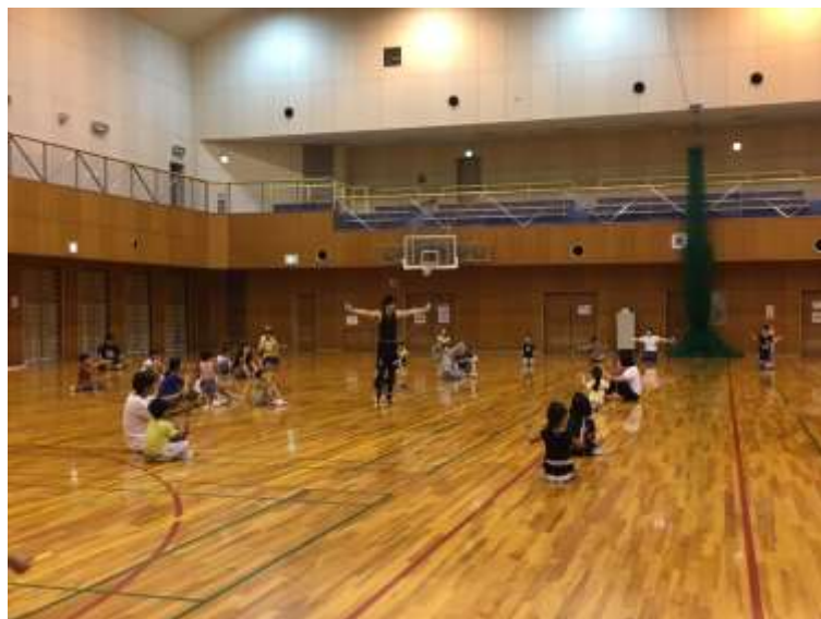
なわとびパフォーマンス&教室