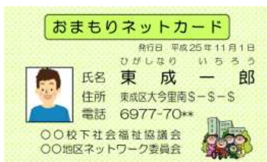
おまもりネットカード