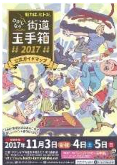
ひがしなり街道玉手箱ガイドマップ

東成区の地域資源を活用し、多様な活動主体と地域がつながる「みんなの玉手箱」（H30 年度より名称変更）の開催にあたり、広報紙等を活用した情報発信を行っていく。