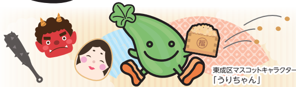
東成区マスコットキャラクター「うりちゃん」