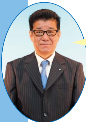
大阪市長 松井一郎

特別区設置後は、選挙で選ばれた4人の特別区長がそれぞれ住民の声を聴きながら、責任を持って判断していくことで、住民サービスの最適化をめざします。