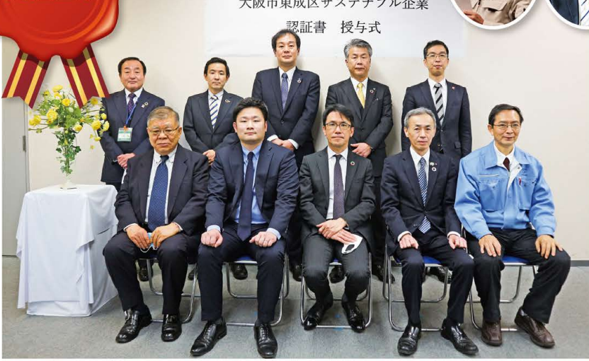
令和2年度 大阪市東成区サステナブル企業 認証書 授与式

東成区役所では、「東成区サステナブル企業認証」制度を創設、今年度初めての認証企業を決定し、新型コロナウイルス感染症感染拡大予防対策を施し、認証書授与式を行いました。