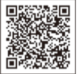
▲ ワクチン接種について詳しくはこちら

予約開始日については、大阪市ホームページ等でお知らせしますので、しばらくお待ちください。