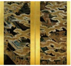
大坂城図屏風(大阪城天守閣蔵)

のかを探ってみましょう。 ☎ 5/31(月)まで 9:00～17:00 (入館は16:30まで) ¥ 入館料: 大人600円 [場] 大阪城天守閣 ☎ 6941-3044 FAX6941-2197