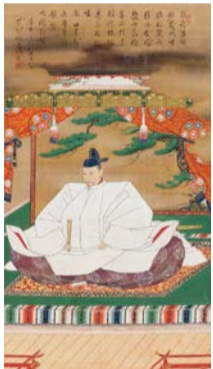
重要文化財《豊臣秀吉像》慶長3年(1598) 賛 京都・高台寺蔵

豊臣家ゆかりの美術工芸品約80点を展示。激動の時代を映す壮麗な造形を紹介し。 ☎ 5/16(日)まで 9:30～17:00(入館は16:30まで)、月曜休館(5/3(月・祝)は開館) [場] 市立美術館 ¥ 大人1,500円ほか [問] 大阪市総合コールセンター ☎ 4301-7285 FAX6373-3302