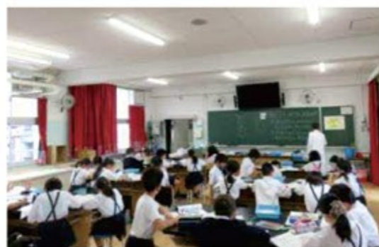
★令和5年度 全国学力・学習状況調査結果(平均正答率)

どの学年の児童も落ち着いて学習に取り組む様子が見られる。今後は、算数科の研究とともに、外国語活動・言語活動の充実を図り、児童が自分で考えたことをそれぞれ根拠を明確にして伝えることができるよう工夫をしていきたい。さまざまな意見を交流する中で、いろいろな人の考え方を知り、それぞれが知識を深め、思考力を高めるようにしていきたい。