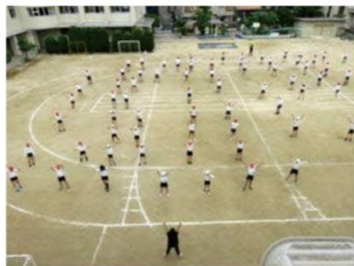
★令和5年度全国体力・運動能力、運動習慣等調査結果(種目別平均値)

運動やスポーツへの興味・関心が高いほど総合評価が高い傾向がみられた。本校では、運動する機会を増やし、運動・スポーツへの興味・関心を高めてきた。今後も、さらに運動・スポーツ好きの児童を増やす工夫をしていきたい。