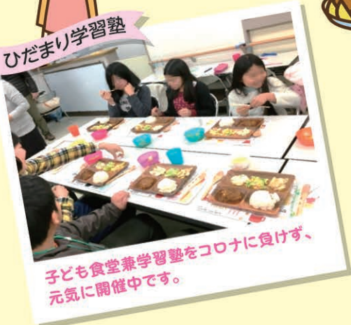
子ども食堂兼学習塾をコロナに負けず、 元気に開催中です。