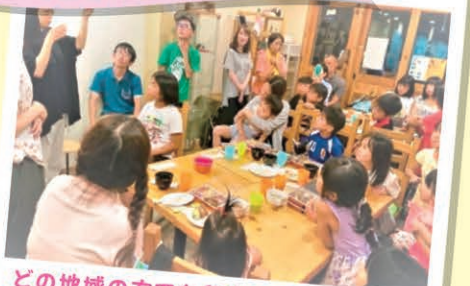
どの地域の方でも参加できます。みんな で一緒にごはんを食べましょう。