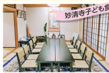
子ども達を見守り、親御さんに少しでも ゆとりをお持ちいただけたらと、子ども (親子)食堂を開く準備をしています。