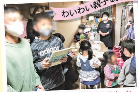
手づくり晩ご飯の提供。話をしてホット できる場でありたい。お待ちしております。