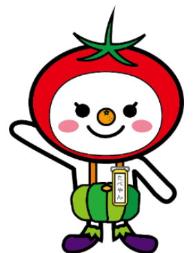
大阪市食育推進キャラクター 「たべやん」