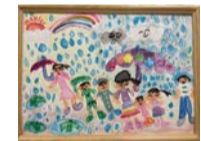
令和3年度 特選賞(1年生)