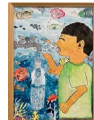
令和3年度 特選賞(5年生)