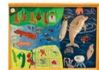
令和3年度 特選賞(4年生)