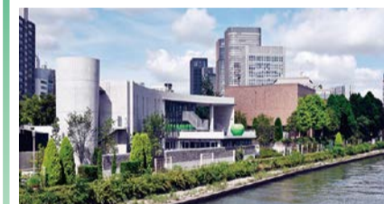
第40回大阪市長賞:こども本の森 中之島 撮影者:安藤忠雄建築研究所

周辺景観の向上に資し、かつ景観上優れた建物やまちなみを推薦していただき、特に優れたものを表彰します。