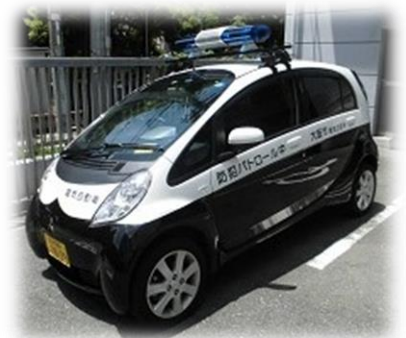
青色防犯パトロールカー

あんパトは、青色防犯パトロールカーや自転車で区内をパトロールしています。また、小学校や幼稚園等、地域での交通安全啓発や防犯啓発など、さまざまな安全対策業務を行っています。特に子どもたちの安全を守るために下校時のパトロールを強化しています。何かありましたら、気軽にお声をかけてください。