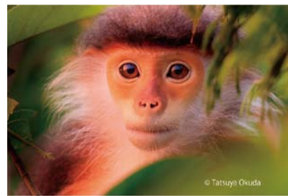
アカアシドクラングール

写真家の奥田達哉さんが東南アジアのジャングルで撮影した霊長類の絶滅危惧種の写真の中から、ユニークな約10種を20m以上にわたる壁面大型写真パネルで展示します。