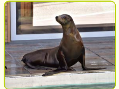
カリフォルニアアシカ