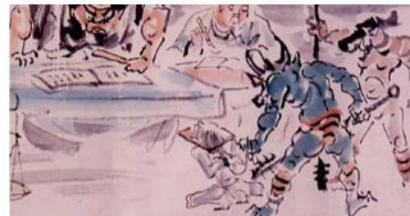
地獄(部分) 菅橋彦筆 明治41年(1908) 大阪歴史博物館蔵

天変地異や災厄の原因を理解し、生の苦しみや死の恐怖を克服するために、人々は「異界」についてどのように捉え、交渉し、また対応してきたのかを民俗・歴史・考古・美術などさまざまな資料から考えます。