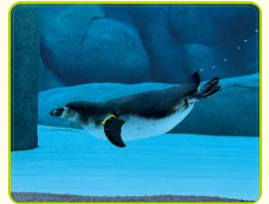
フンボルトペンギン