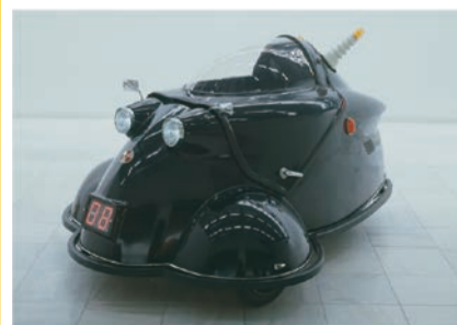
ヤノベケンジ《アトムカー(黒)》1998年 国立国際美術館蔵 ©Copyright KENJI YANOBE

大阪中之島美術館の活動の両輪であるアートとデザインを並行的に紹介する展覧会。およそ100点におよぶ戦後日本の多彩な作品を時とともに追いながら、デ