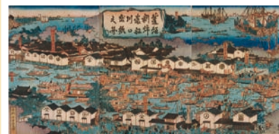
菱垣新綿番船川口出帆之図

徳川幕府のもとで息を吹き返して経済の中心地となり、幕末政治の舞台ともなった大坂の歩みをたどります。