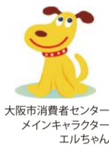
大阪市消費者センターメインキャラクター エルちゃん

「スマホでSNSの広告を見て、化粧品を1回だけのつもりで購入したが、定期購入契約になっていた」などのトラブルが増えています。困ったら、気軽にご相談ください。消費生活相談は市内在住の方に限り、☎・面談(事前予約制)・✉で行っています。 ☎ 月～土曜10:00～17:00(祝日除く) ☎ 大阪市消費者センター消費生活相談専用電話 ☎ 06-6614-0999 ☎ 06-6614-7525