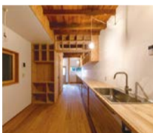
改修イメージ(改修前→改修後)