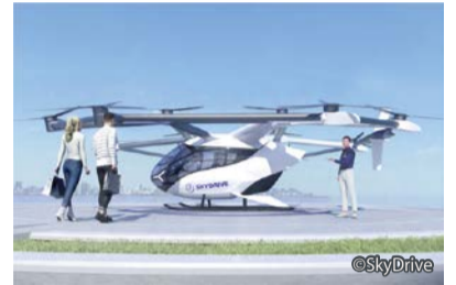
空飛ぶクルマの機体イメージ