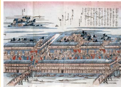
浪華の花櫓 江戸時代 大阪歴史博物館蔵

大阪を代表する繁華街、キタとミナミ。館蔵資料と関連資料を通して、それぞれの街の魅力に迫ります。