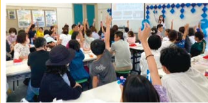
クイズ大会の様子