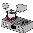
火災の発生が多い月

出火原因で最も多いのはコンロで、次いでタバコ、配線器具、ストーブと続きます。今のうちに、家具の裏など見えにくい部分のコンセント周りのほこりを掃除し、火災報知機の使用期限を確認するなど、寒い冬に備えておきましょう！