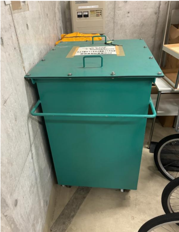
1 運搬容器 グリーンボックス 幅 680mm×奥行 780mm×高さ 1.100mm