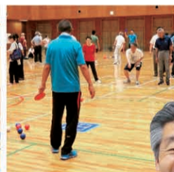
ポッチャ大会で審判もやっています

ポッチャ大会をはじめ、様々なところでスポーツをより楽しく、より身近にとの思いでがんばっていただいています。いつも本当にありがとうございます。