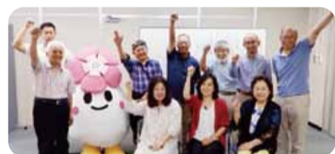
なでしこライターは、5月号から区内の小学校と中学校をどちらか1校ずつご紹介いたします。お楽しみに☆