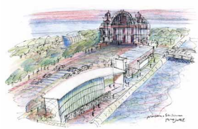
御堂筋の側道歩行者空間化イメージ▶