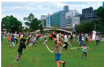
昨年の体験型アクティビティの様子

水辺の芝生で楽しく過ごす「クラフトピアピクニック」や体験型アクティビティといった親子で楽しめる外遊びなど、中之島公園を中心に水辺に親しむプログラムを多数展開。詳しくは HP をご覧ください。