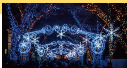
昨年の様子

日 12/14(土)～25(水) 場 市役所周辺～中之島公園 今年は、一部点灯期間を設けます。 日 11/4(月・休)～12/13(金)、12/26(木)～31(火) 17:00～23:00 場 市役所正面、みおつくしプロムナード