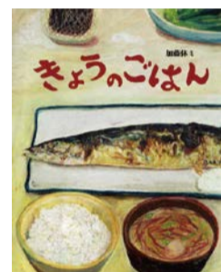
『きょうのごはん』 作 加藤休三(備成社)

『きょうのごはん』など、クレヨンでおいしそうな食べ物を描く絵本作家・加藤休三さんによる絵本の読み聞かせとワークショップ。ワークショップでは皆さんが描いた絵を合わせて、大きな「中央図書館定食」を作ります。定員60組。幼児は保護者同伴。 日 11/24(日) 14:00～16:00 場 中央図書館 締 11/10 申 問 ホームページまたは往復ハガキに、代表者の氏名・住所・電話番号・参加者全員(4人まで)の氏名・子どもの年齢・ワークショップ前のお手洗い係希望の有無を書いて、〒550-0014 西区北堀江4-3-2、中央図書館「加藤休三ワークショップ係」へ。 ☎ 6539-3326 FAX 6539-3336