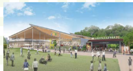
てんしば i:na 完成予想イメージ

飲食店やボルダリング・アスレチック施設、グッズショップなどが並ぶ「てんしば i:na」のオープンを記念し、動物とのふれあいコーナーなどを設置します。 日 11/22(金)～24(日) 11:00～19:00 (11/22(金)は10:00～) 場 てんしば i:na 問 天王寺動物園 ☎ 6771-8401 FAX 6772-4633