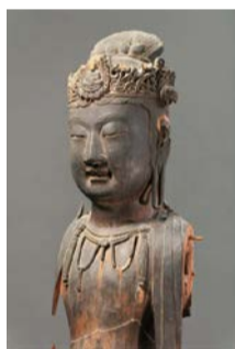
重要文化財 木造観音菩薩立像(部分) 隋時代 大阪・堺市博物館

日本の仏像に大きな影響を与えた中国の仏像・仏画。南北朝時代から明・清時代まで1000年を越える仏像の移り変わりを、関連する日本の仏像とともにご紹介。 日 12/8(日)まで 9:30～17:00(入館は16:30まで)、月曜休館(月曜が祝日の場合は翌平日) 場 市立美術館 ¥ 大人1,400円ほか 問 大阪市総合コールセンター ☎ 4301-7285 FAX 6373-3302