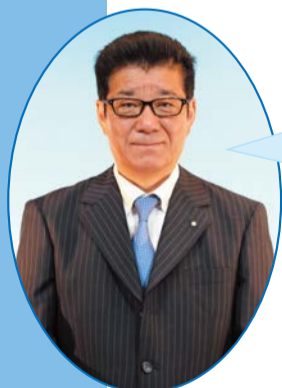
大阪市長 松井一郎

現在、議論されている特別区素案は、前回の案(平成27年住民投票実施)からバージョンアップしています。前回の案に対する住民の皆さんの