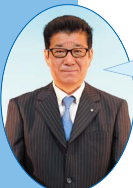
大阪市長 松井一郎