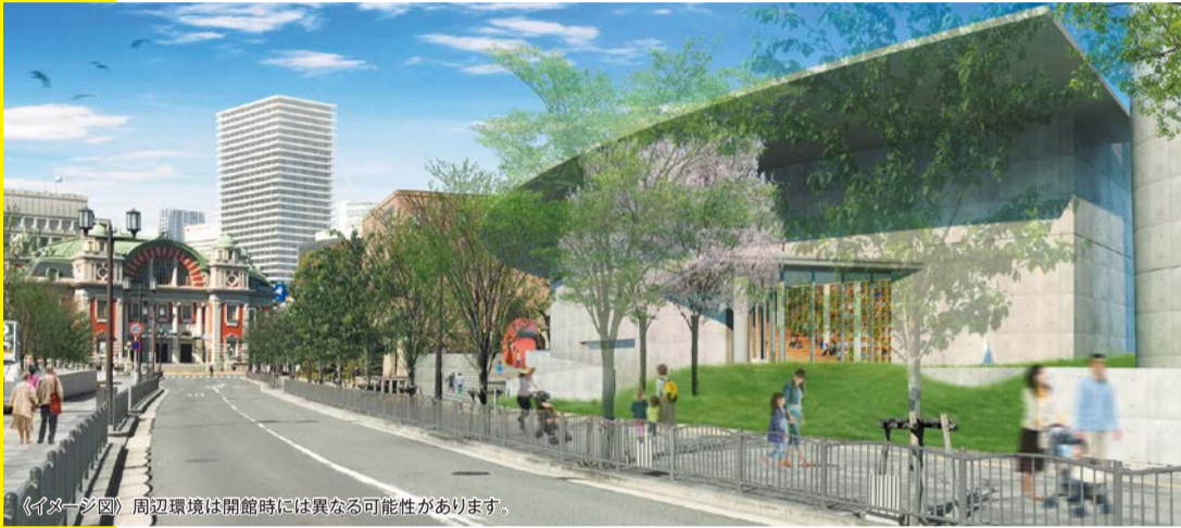
《イメージ図》周辺環境は開館時には異なる可能性があります。