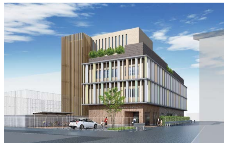
建物正面から見たイメージ図