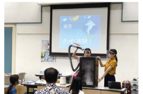
気象キャスターによる竜巻実験

幼児～小学生を対象に、水に関するワークショップや体験型のイベント、謎解きなどを開催。定員各回40人(事前予約制)。 日 3/27(土)・28(日)各日①10:00～11:40、②13:00～14:40 場 水道記念館 申 3/14 17:00までにHPで。 問 水道局総務課 ☎ 6616-5404 FAX 6616-5409